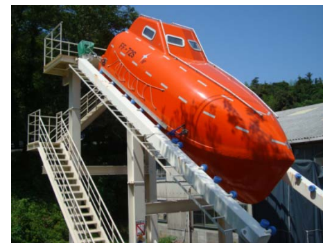
・ 自由降下式救命艇